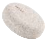
Art. no.: 15832

Den lækre pimpsten lokker til berøring med sine afrundede hjørner og ru tekstur. Og så er den et lille vidundermiddel til fødder, knæ og albuer, der trænger til ekstra kærlighed. Pimpstenen har samme formsprog som INU's kollektion af børster, spejle og fodfile og vil klæde din bruseniche.