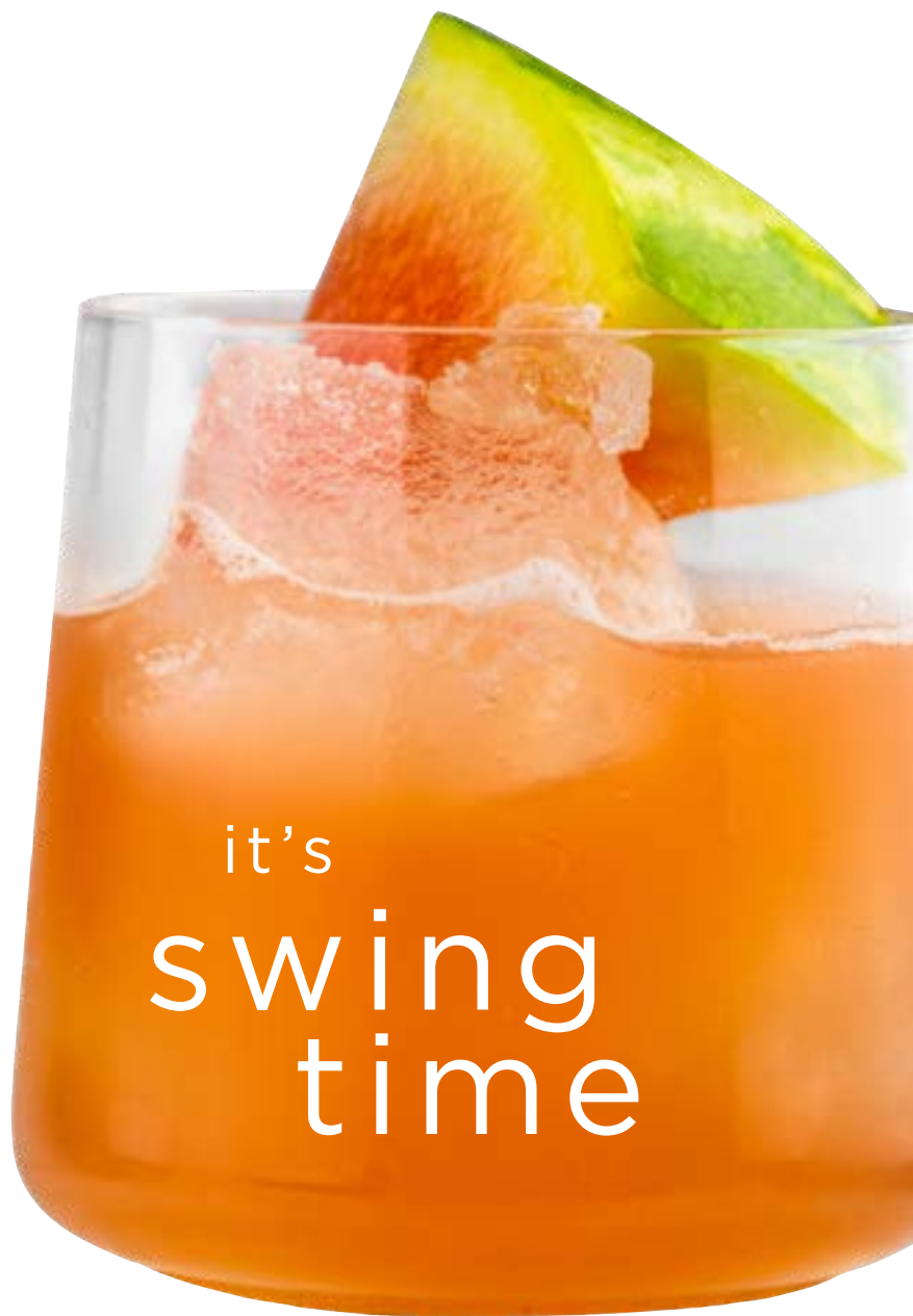
Little Miss Emperor