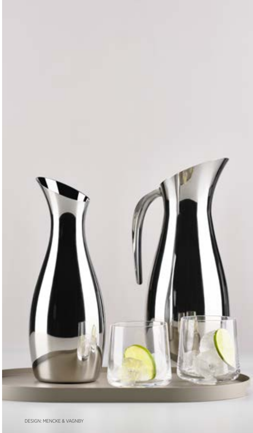
DESIGN: MENCKE & VAGNBY

Den elegante kande kommer nu i en mindre udgave uden hank, der passer perfekt, når du serverer et glas vand til vinen. Kanden rummer 1 liter og fås også i enten sort eller blankt stål.