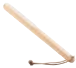
Art. no.: 15828 Beech