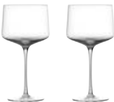
Art. no.: 332101 Clear