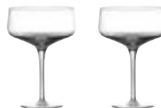
Art. no.: 10600 Clear