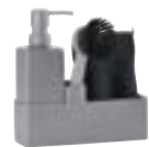
Art. no.: 15241 Cool Grey