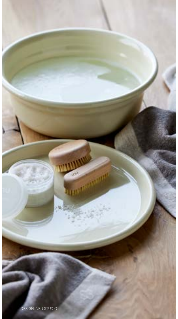
DESIGN: NEU STUDIO

Fodspaen fra INU er en lækker nyfortolkning af det klassiske vaskefad. Den emaljerede balje har en blødt kurvet kant, der er behagelig at gribe om og rar at hvile anklernerne på. Baljens størrelse er perfekt til fodbad, og sidernes bløde 'knæk' angiver, hvor meget vand du behøver til din spa. Baljen har et låg, som kan bruges som bakke til fodsalt, børster, olier, neglelak eller en afslappende te.