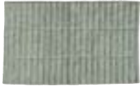
Art. no.: 23884 Matcha Green