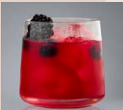
The Blue Bramble