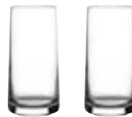
Art. no.: 332099 Clear