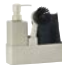
Art. no.: 15240 Mud