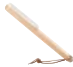
Art. no.: 15831 Beech