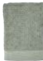
Art. no.: 15361 Matcha Green